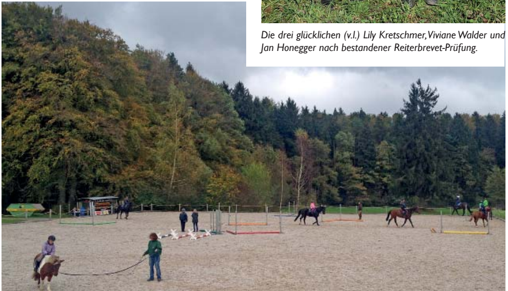
Juniorenreitstunde auf dem Pfannenstiel.